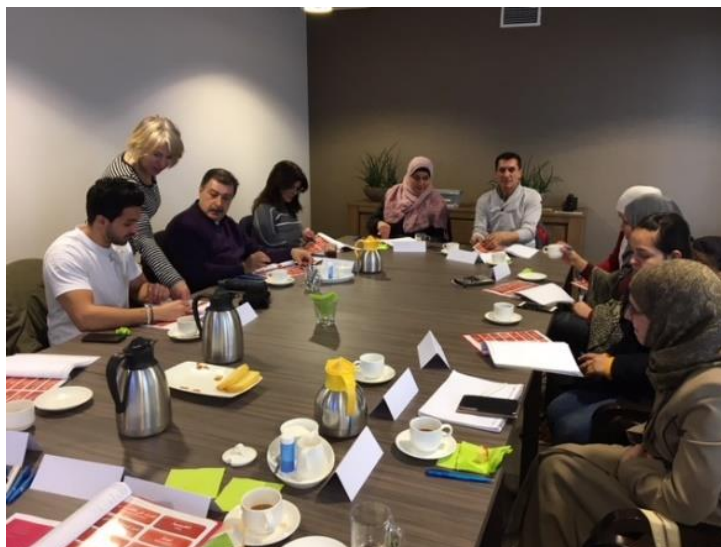
workshop GGD, groep Syriërs, Grave