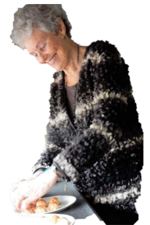
Gastvrouw Sociom|Zin actief voor Er op Uit op Zondag

Als je graag een verdiepend gesprek voert met andere senioren, dan kun je aansluiten bij Er op uit op Zondag. Om de week begeleiden twee gastvrouwen of –heren deze groep.